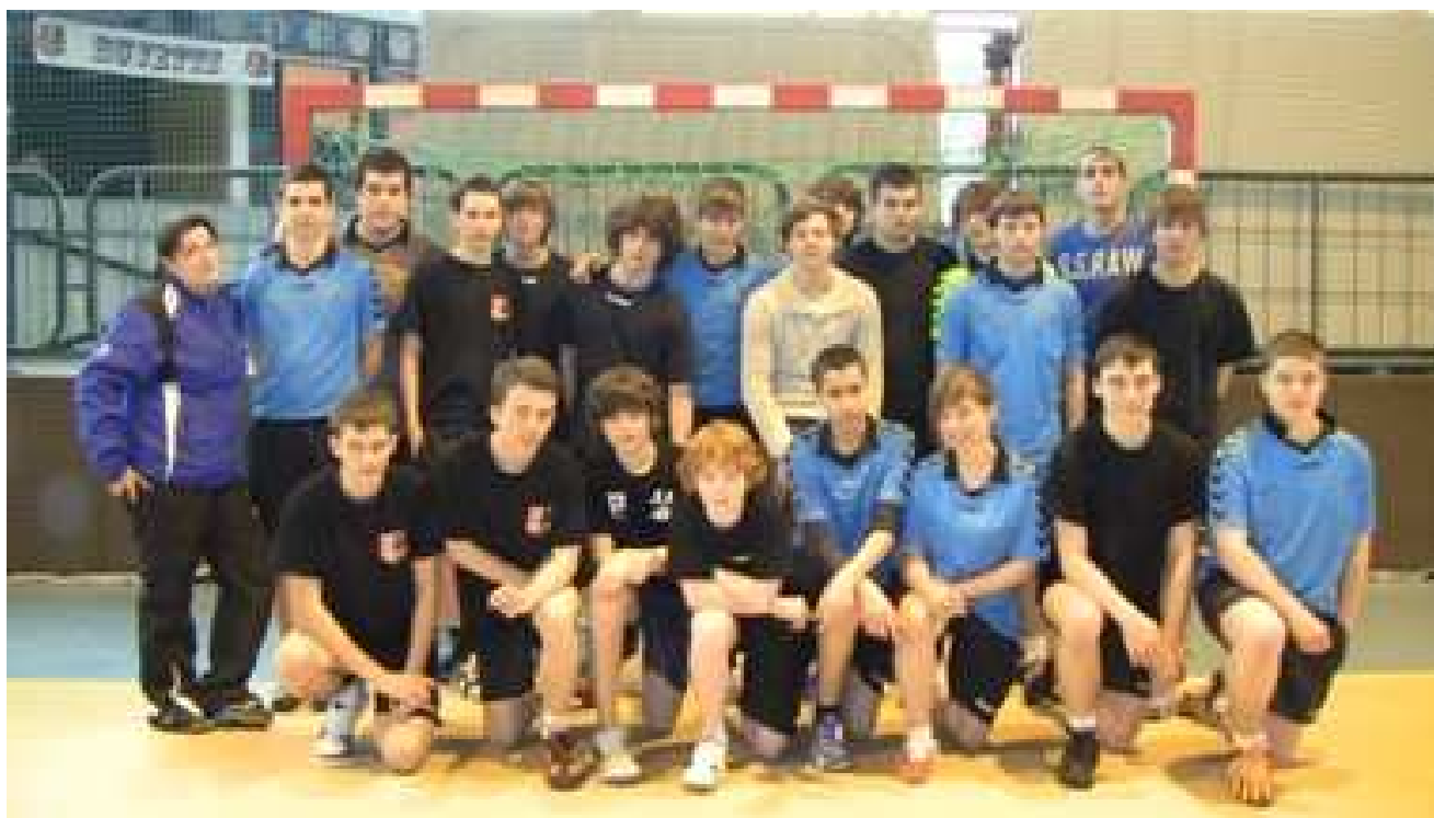
COMMISSION DEPARTEMENTALE JEUNES ARBITRES /CDJA COMITE DEPARTEMENTAL DE HANDBALL DES YVELINES